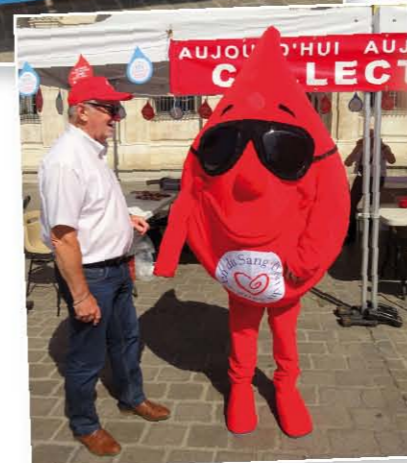
Collecte devant l'Hôtel de ville de Troyes le 14 juin, à l'occasion de la journée mondiale des donneurs de sang bénévoles.