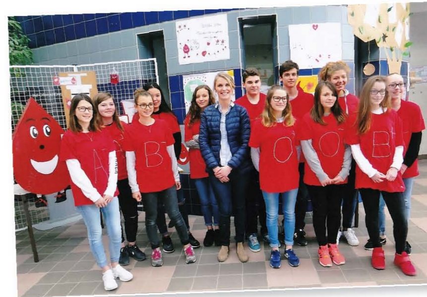
Collecte de sang organisée par les élèves du collège EUREKA de Pont-Sainte-Marie le jeudi 23 mars 2017.

Et devenez un héros en quelques minutes!