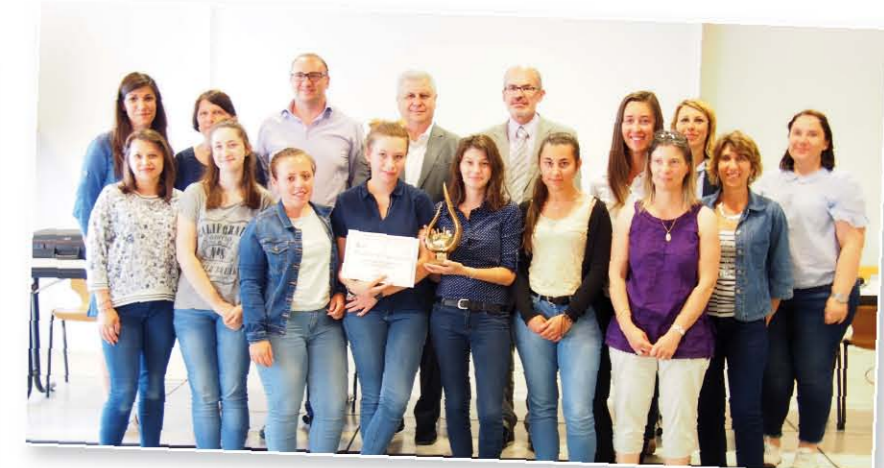
Lycée Marie de Champagne. Remise du trophée pour 15 ans de fidélité à la collecte de don de sang.