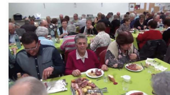
La soirée choucroute

Les interventions à domicile sont assurées 7 jours / 7