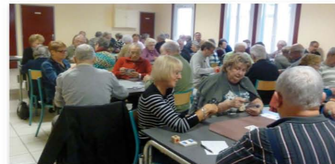
Le samedi 16 Décembre 2016, les bénévoles ont réuni 44 équipes de joueurs de Belote.