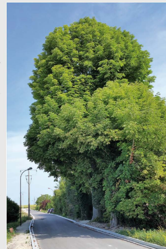
Rue Chaumard – les marronniers, identifiés et classés dans le plan local d'urbanisme, ont été préservés lors des travaux.

Octobre : Travaux relatifs aux espaces verts et plantations.