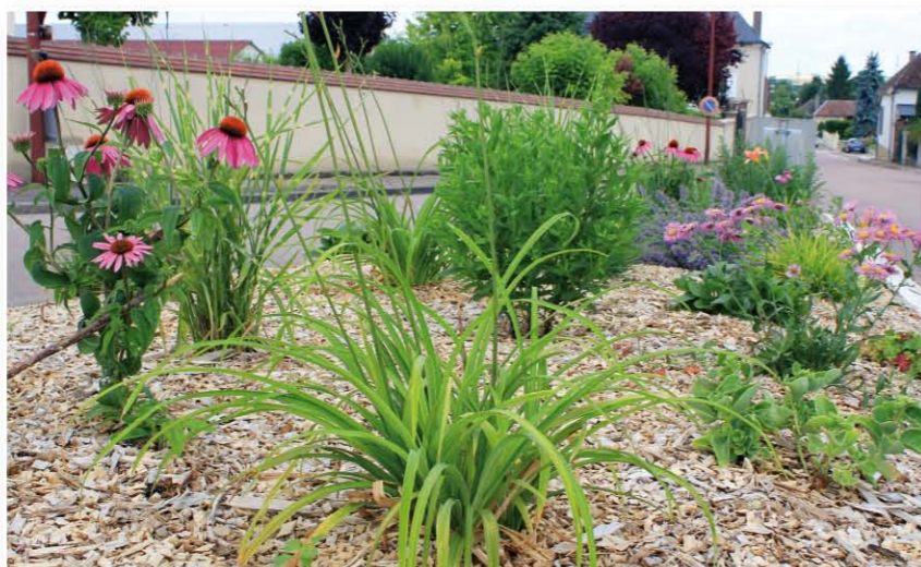
Massif de plantes vivaces rue du Moulin

Notre paysage périurbain va donc se modifier, il faudra s'y habituer. Quelques esprits chagrins pourraient se plaindre des herbes folles et des fleurs sauvages... qui osent pousser dans un village qui conserve encore malgré tout un caractère rural affirmé.