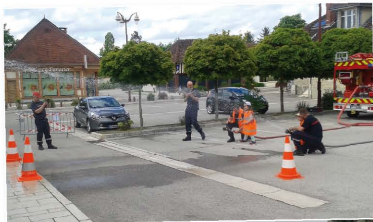
Journée portes ouvertes