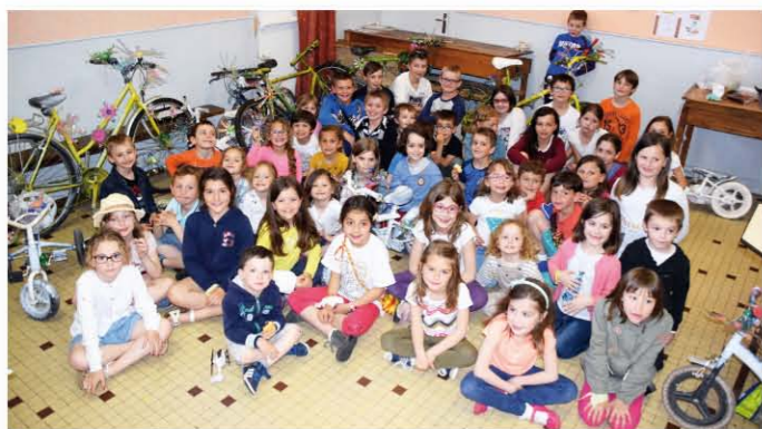
Le Rallye des enfants

Le dimanche 14 mai 2017, une cinquantaine d'enfants des écoles maternelle et primaire de Creney, accompagnés de leurs parents, ont répondu présents à l'invitation de l'association des parents d'élèves pour un rallye.